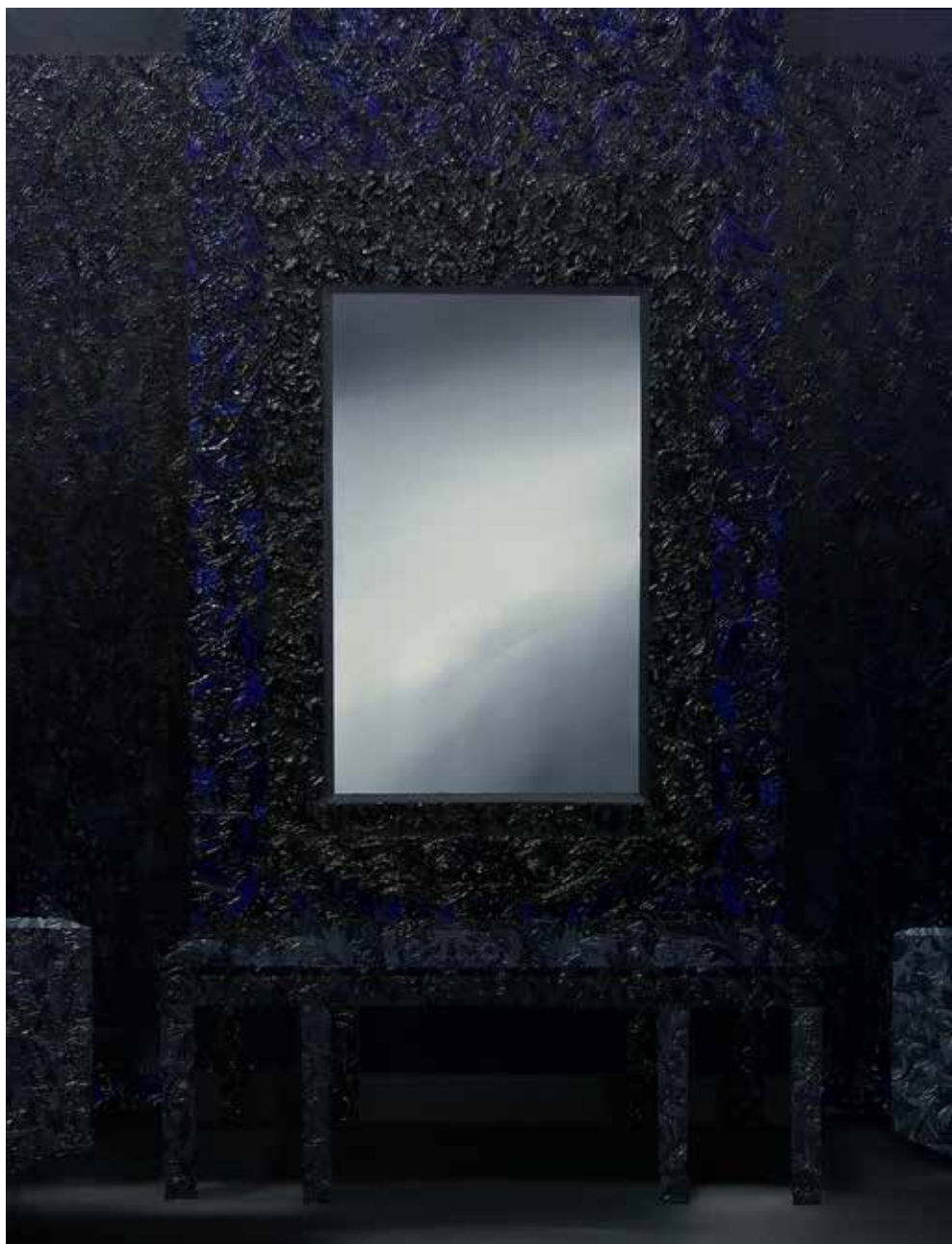
bez tytułu I, olej wodny na płótnie, 130x100 cm, 2014