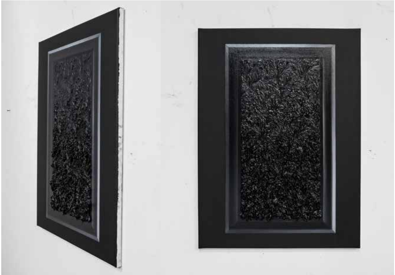
bez tytułu IV, olej na płótnie, 54x73 cm, 2014