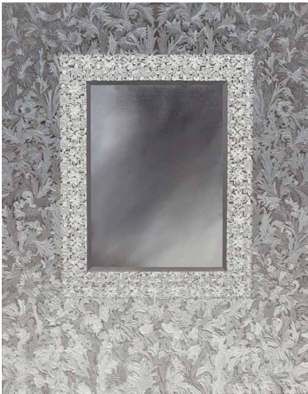
bez tytułu VII, olej na płótnie, 73x92 cm, 2014