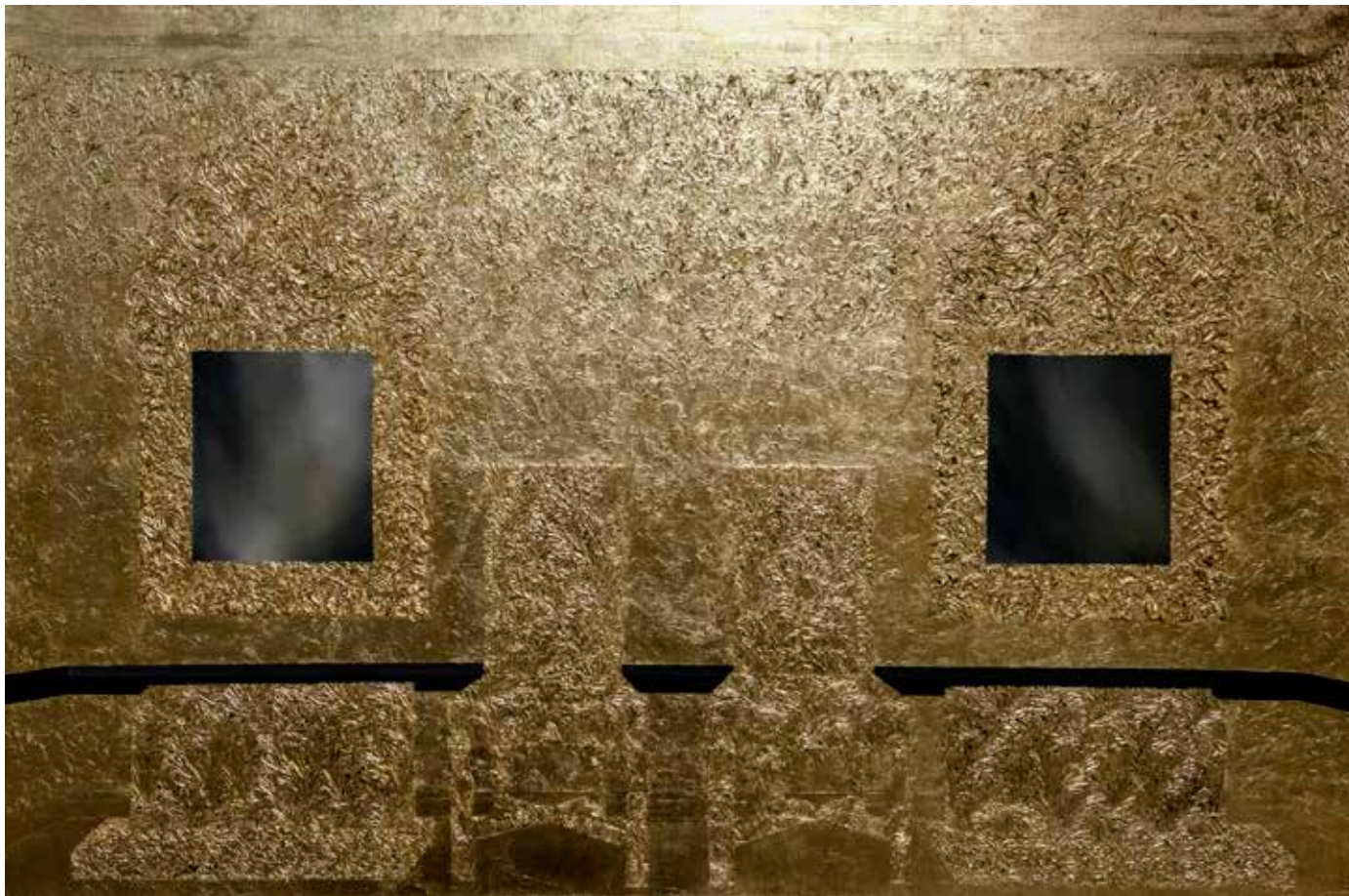
bez tytułu XII, olej wodny, szlagmetal na płótnie, 150x100cm, 2015