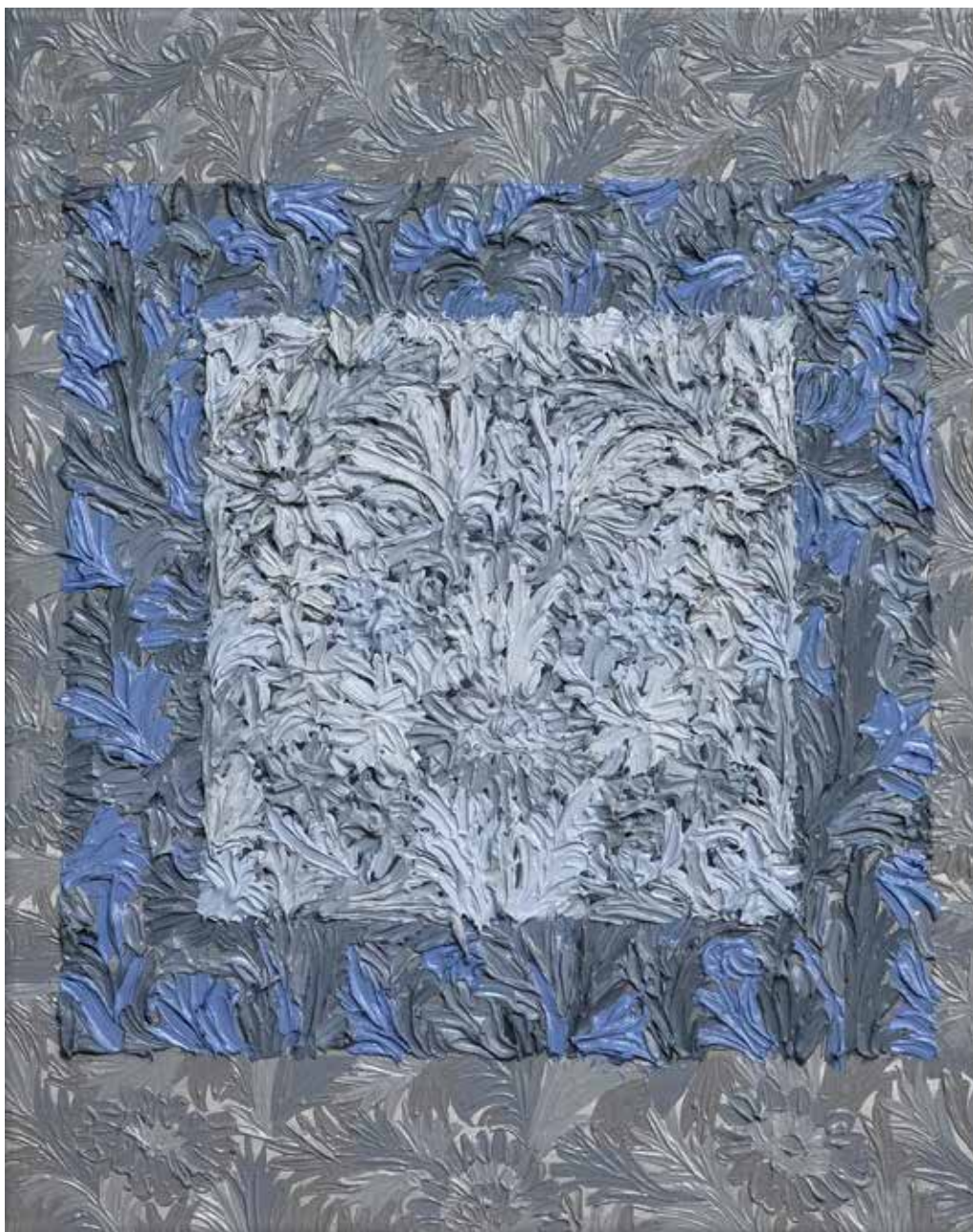
bez tytułu X, olej na płótnie, 40x50cm, 2015